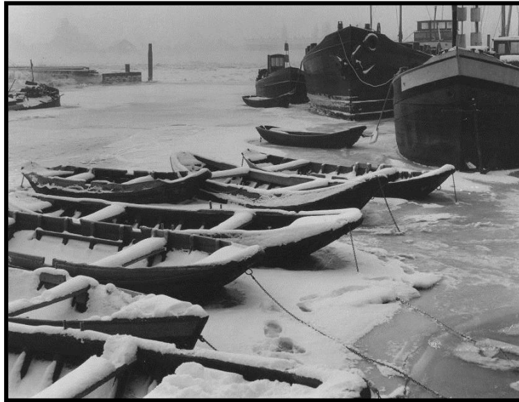
Te verhuren roeiboten achter het café

Bij de grote dijkverhoging werden de omliggende panden en schuren afgebroken (Bezemer, Vermeer, Nobel) maar het café werd gerezen en daardoor ontstond er een groot onderhuis.