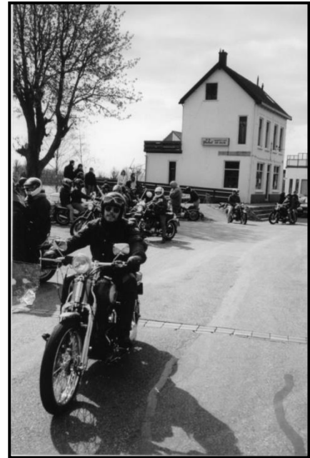
“BARGEZELLIG” als stopplaats voor fietsers en motorrijders