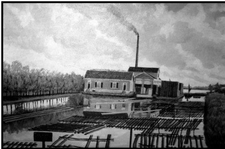
Oude stoommolen van houthandel fa. Boogaerd

Mijn bezoek was precies op 1 febr. 2013 de dag waarop de watersnood van 1953 werd herdacht. Het gesprek kwam natuurlijk op de gebeurtenissen welke in de watersnoodnacht van 31 januari op 1 februari 1953 rondom dit huis plaatsvonden. Men was wel hoog water gewend in dit huis maar nu ging het goed mis, het water steeg tot het plafond in het onderhuis. Natuurlijk had men alle belangrijke zaken al naar boven gebracht.