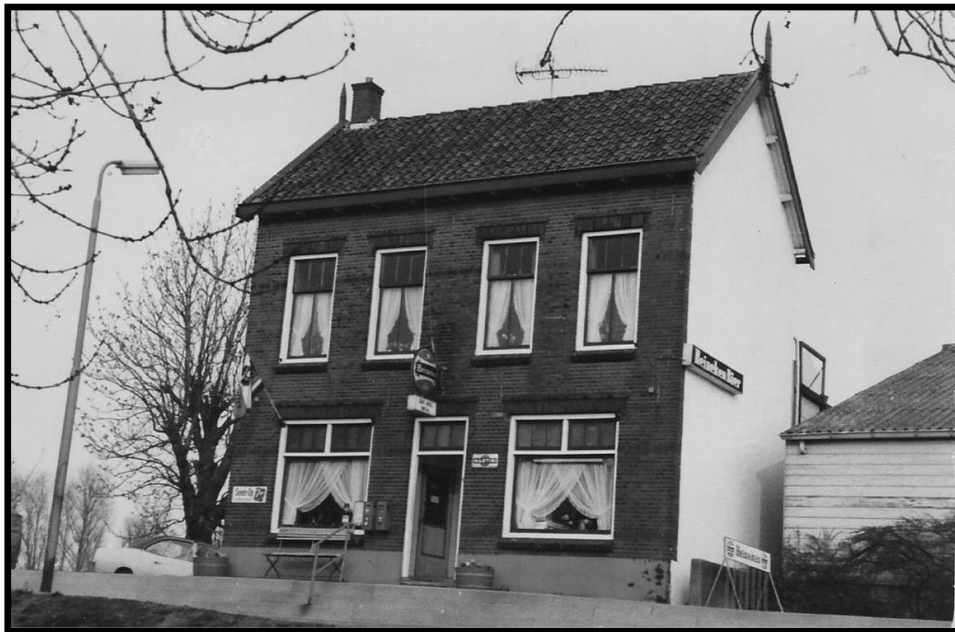
Café "BAR GEZELLIG"