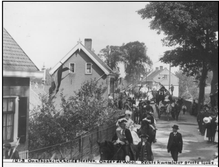
Gedeelte optocht Onder de Waal

Het heel maakte een rijke indruk. De optocht die tamelijk lang was trok in de beste orde door ons dorp. Te 1 uur werd hij ontbonden.